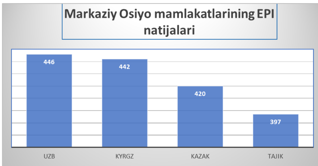
1-rasm:2022-yilda o'tkazilgan EPI Markaziy Osiyo mamlakatlari natijasi 30

Reytingda 661 ball bilan Niderlandiya yetakchilik qilmoqda, Singapur (642 ball) va Avstriya (628 ball) uchinchi o'rinda.