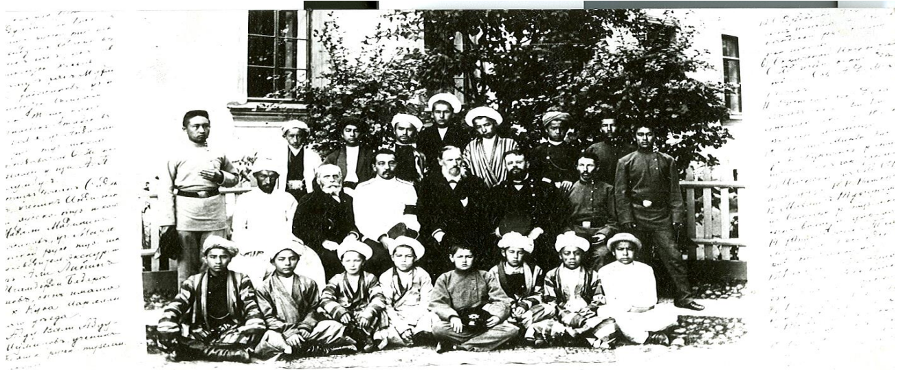
Первая экскурсия по Европейской России Туркестанских туземных мальчиков, сфотографированная Глав. Начальником края Ген.-отъ Инф. С. М. Духовским летом 1898 г. С.-Петербурга.

1898 й. Июнь, Санкт-Петербургга биринчи экскурсия иштирокчилари. Муаллиф – Ю.Никонович. (ЎЗР МДА КФФХ, фото бўлим А-60, 1 расм)