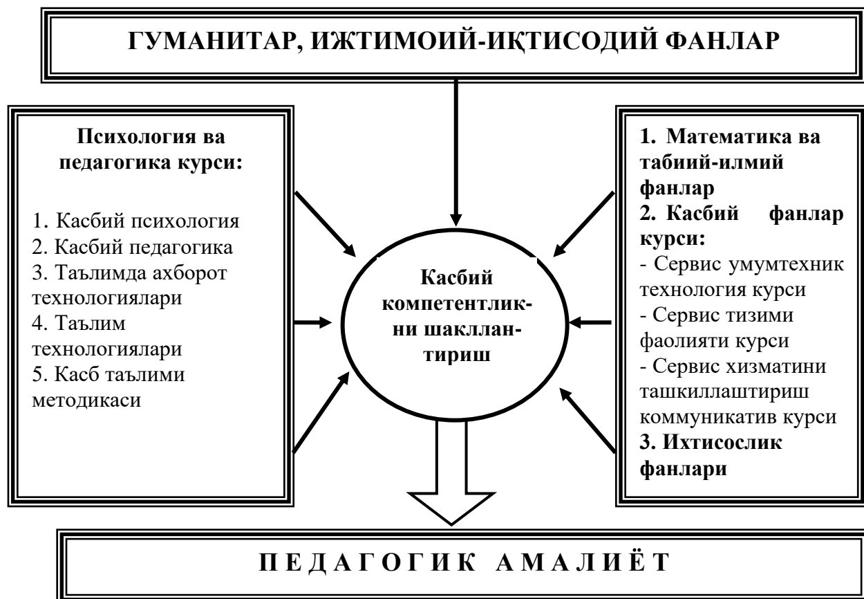
2-расм. Касб таълими ўқитувчилари касбий компетентлигини шакллантиришда педагогик ва техник билимлар интеграцияси

Юқорида санаб ўтилган фанлар касб таълими методикаси фани мазмунида интеграциялашиб, педагогик амалиёт жараёнида ўз татбиқини топади (2-расм). Бундан хулоса чиқариш мумкинки, касб таълими методикаси фани ўқитувчининг касбий компетентлигини шакллантиришда интеграциялаштирувчи аҳамиятга эга бўлиб, уни мазмунан таркиб топтиришда ўқув режасига кирувчи барча фанлар хусусиятлари эътиборга олинади.