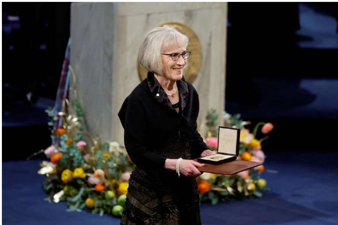
Нобель мукофотини топшириш маросимидан лавҳа.