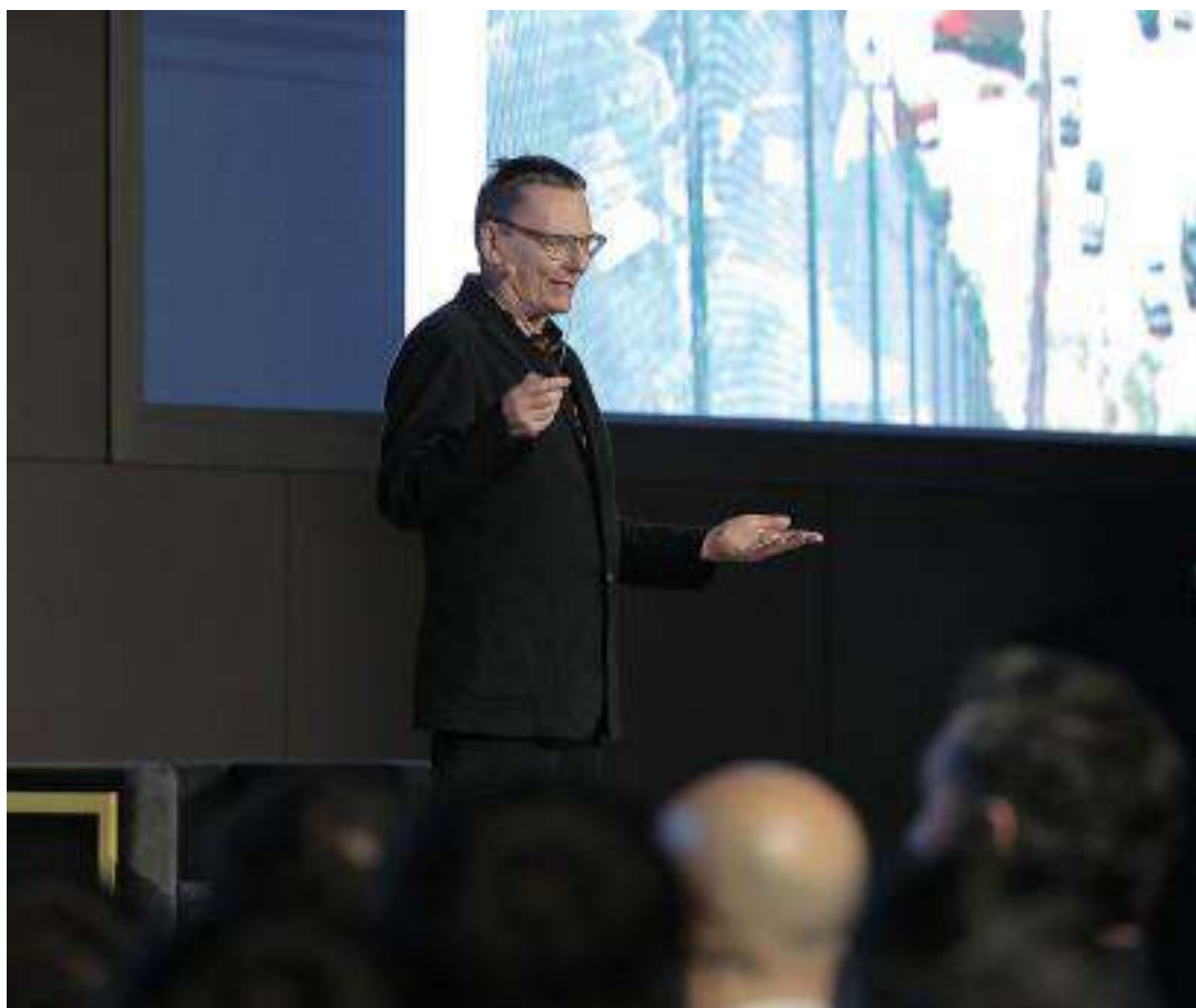
Тошкентда «Мамлакатлар таназзули сабаблари» китоби ҳаммуаллифи, Чикаго университети профессори Жеймс Робинсон билан учрашув. 2023 йил 17 март.