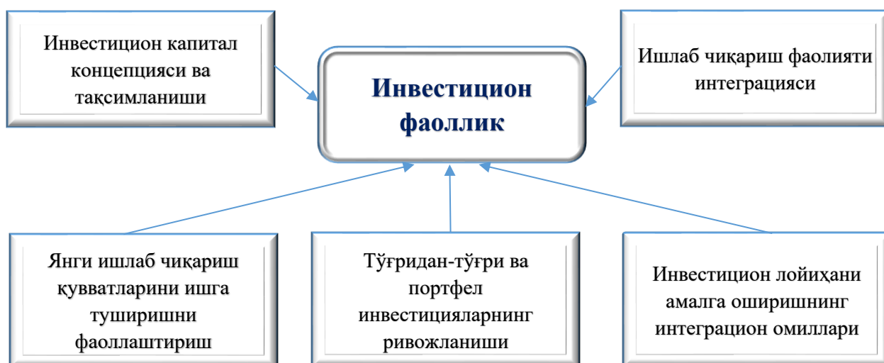
4-расм 4 .

Инвестицион жозибадорликка инвестицион риск тескари (салбий) таъсир кўрсатади. Юқорида баён этилган фикрларни давом эттирган ҳолда, инвестицион риск ва уни интеграл баҳолаган ҳолда қуйидаги гуруҳларга бўлиб талқин этиш мумкин: молиявий (давлат/маҳаллий бюджет ва корхоналар бюджетининг баланслаштирилганлиги); иқтисодий (ҳудуднинг иқтисодий ривожланиш тенденцияси); ижтимоий (ҳудуднинг ижтимоий кескин ҳолати); жиноятчилик (ҳудуддаги криминал вазият, тез-тез содир бўладиган оғир жиноятлар, иқтисодий жиноятлар ва босқинчилик ҳолати); экологик (атроф-муҳитнинг ифлосланиши, радиацион ҳолатлар); бошқарув (мақсадли дастурларнинг мавжудлиги, бошқарув фаолиятининг ривожланганлик даражаси, бюджет ва унинг устидан оқилона бошқарув).