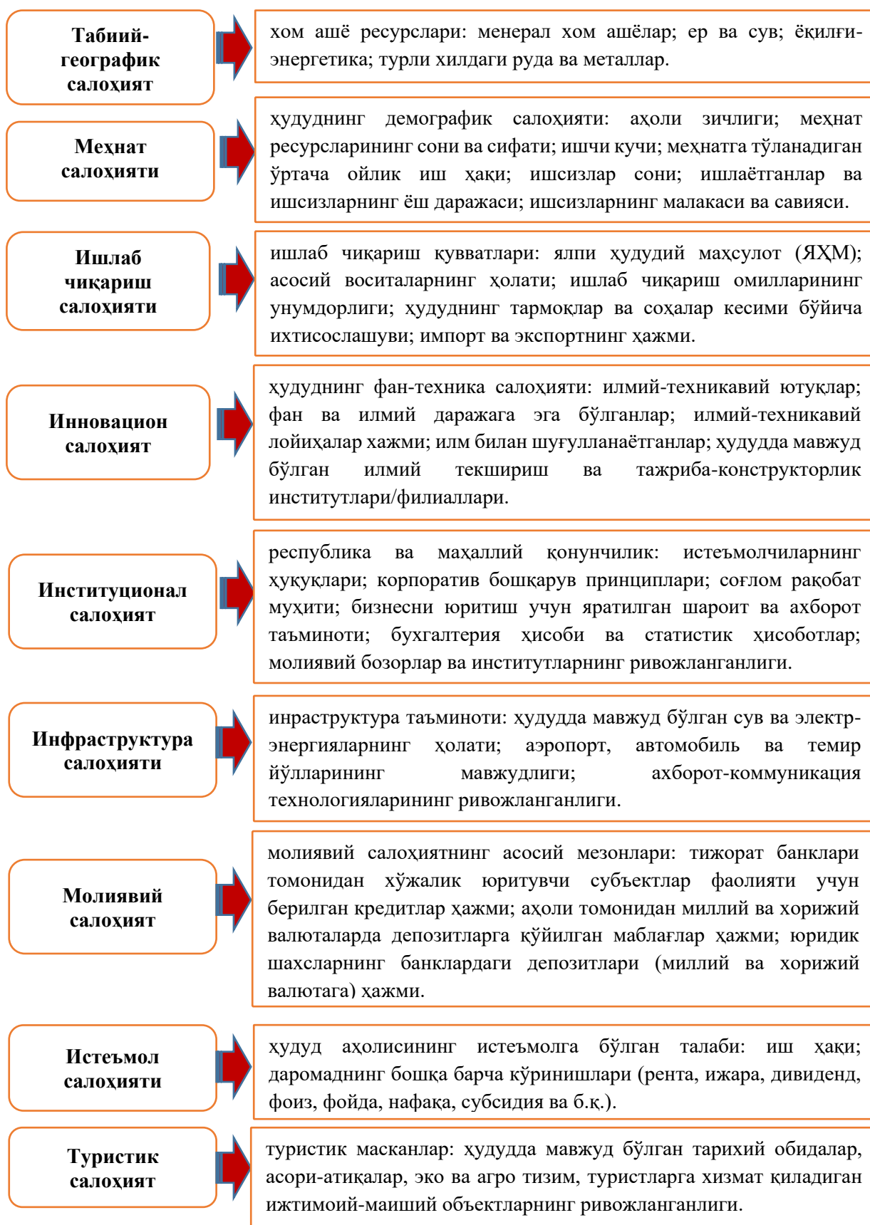
2-расм. Ҳудудларнинг инвестицион салоҳияти даражасига таъсир кўрсатувчи омиллар.