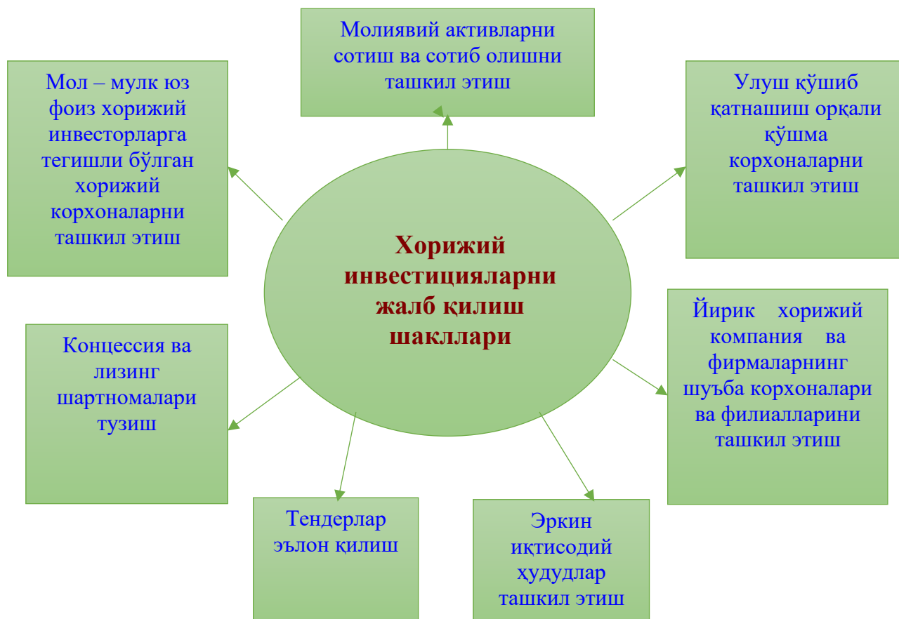
1-расм. Хорижий инвестицияларни жалб қилиш шакллари 2

сабабларини инобатга олиш; ишончли шерик танлаш; хорижий инвестициялар иштирокидаги корхона барпо этиш ҳақида қарор қабул қилиш.