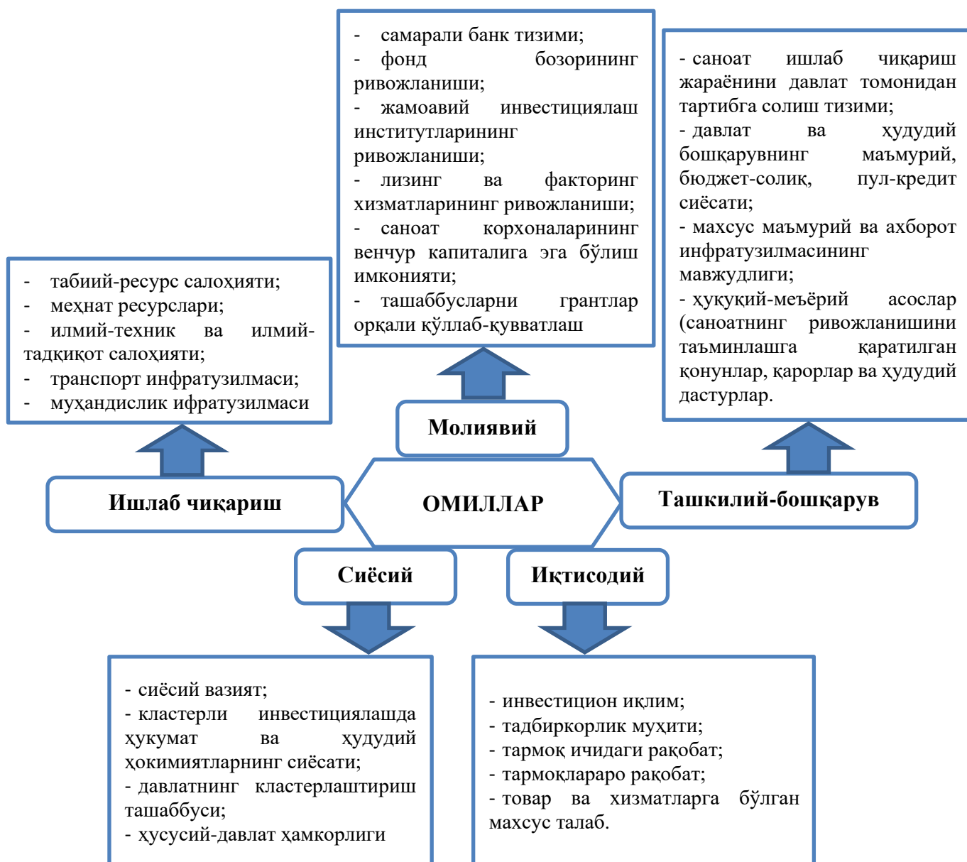
4-расм. Кластерларни ривожлантириш омиллари.

Мазкур тадқиқот давомида аниқланган ҳудудий кластерларни инфратузилмавий таъминлашни шакллантириш хусусиятлари ҳудудий кластерларни ривожлантириш дастурларида ҳисобга олиниши лозим бўлган ривожлантириш институтларини ташкил этиш (ҳамкорликка жалб этиш) заруратини аниқлаш имконини беради.