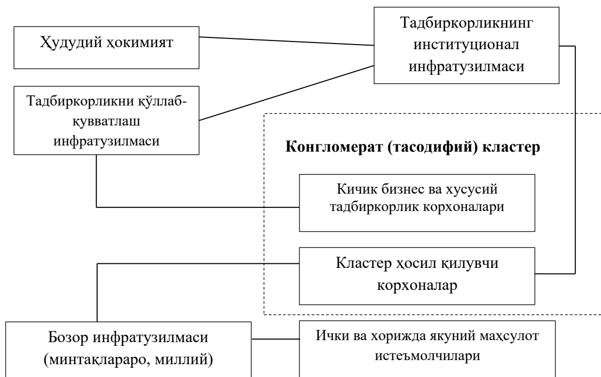
3-расм. Конгломерат (тасодифий) кластернинг ташкилий-иқтисодий модели.

2-босқич. Кластерни ривожлантиришнинг устувор йўналишлари бўйича тажриба лойиҳаларини ишлаб чиқиш ва амалга ошириш.