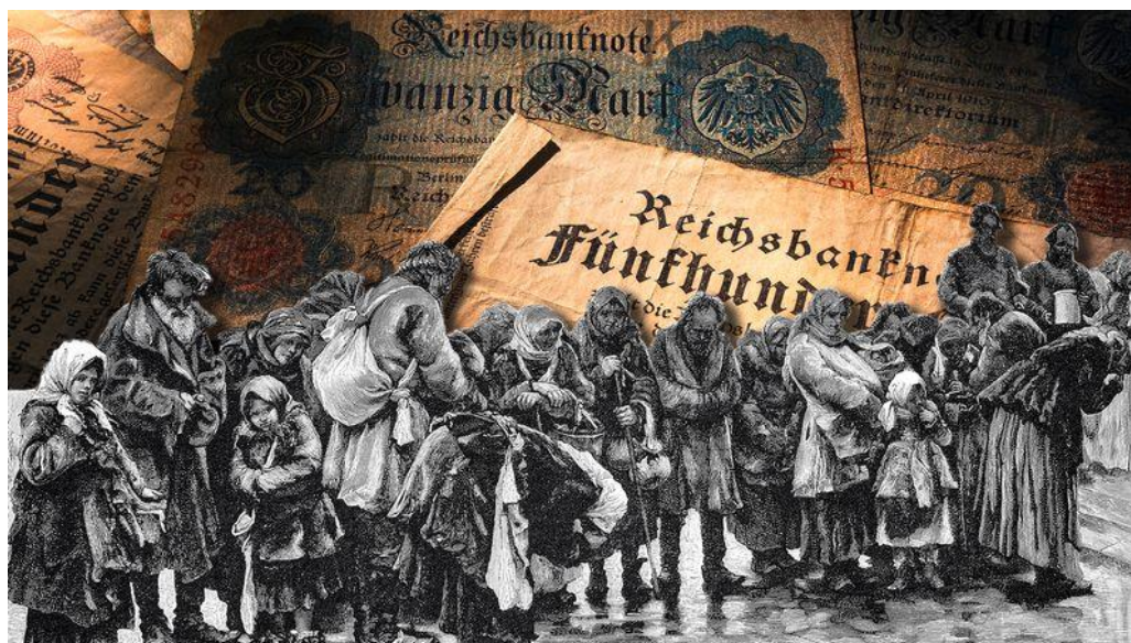
Rasm 2. XVIII-asrdagi savdo jarayoni.

18-asrda professional savdo sohasiga axborot tarqatish usullarining rivojlanishi, ayniqsa bosma materiallar orqali, sezilarli ta'sir ko'rsatdi. Matbaa mashinasining paydo bo'lishi savdo bilan bog'liq ma'lumotlarni, jumladan, pamfletlar, gazetalar va kitoblarni keng tarqatishga imkon berdi. 1750-yillarga kelib, Yevropa bo'ylab 1,000 dan ortiq gazeta nashr etilgani taxmin qilinadi, ularning aksariyati savdogarlar va tijoratchilar uchun tijoratga oid ma'lumotlarni o'z ichiga olgan. Shu davrda savdo kataloglari va almanaxlar tashkil qilindi, ular bozor narxlari, yuk tashish yo'nalishlari va mahsulot mavjudligi haqida muhim ma'lumotlar taqdim etdi. Masalan, "London Gazette" (1665-yilda birinchi marta nashr etilgan), 18-asrda yanada ahamiyatli bo'lib, biznes e'lonlari va savdo yangiliklari uchun muhim manbaga aylangan.