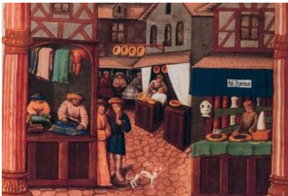
Rasm 1. XVII-asrdagi savdo jarayoni.

XVII asrda axborot professional savdoning muhim tarkibiy qismiga aylanishi bosma texnologiyalaridagi taraqqiyot va yanada tartibli tijorat amaliyotlarining shakllanishi bilan bog'liq edi. XV asr oxirlarida bosma mashinaning ixtiro qilinishi axborotning tez tarqalishi uchun asos yaratdi, bu esa savdogarlar va tijoratchilar uchun tobora muhim ahamiyat kasb eta boshladi. 1600-yilga kelib, Yevropada savdo ma'lumotlari, tartib-qoidalar va iqtisodiy yangiliklarni o'z ichiga olgan pamfletlar, kitoblar va axborotnomalar kabi bosma materiallar ko'paydi. Masalan, 1700-yilga kelib, Yevropa bo'ylab 1,5 milliondan ortiq kitob nashr etilgani taxmin qilinadi, ularning ko'pchiligi savdo va tijorat bilan bog'liq ma'lumotlarni o'z ichiga olgan. Bu bosma materiallarning keng tarqalishi savdogarlarga bozor sharoitlari va tendensiyalariga asoslangan holda ongli qarorlar qabul qilish imkonini berdi.