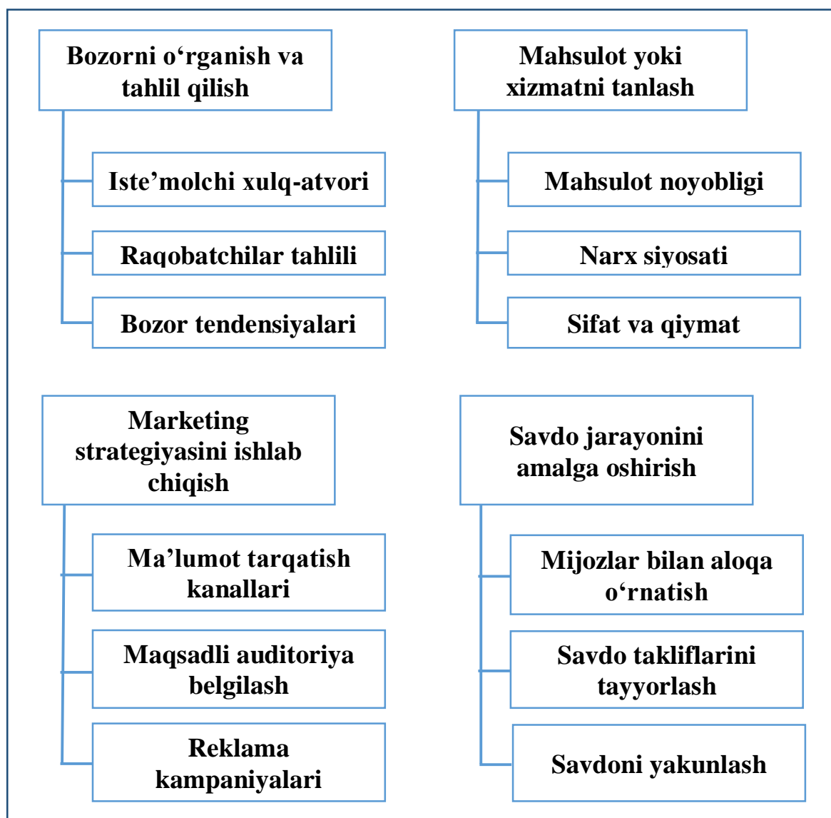
Rasm 6. Professional savdoda tovar aksiyalarini amalga oshirishning asosiy bosqichlari.

Tovar aksiyalarini amalga oshirish jarayonini bosqichlarga ajratish, professional savdo faoliyatida bir qator muhim maqsadlarni ko'zlaydi. Birinchi navbatda, bu jarayonni tizimli va tartibli ravishda boshqarishga yordam beradi, shuningdek, har bir bosqichda aniq vazifalar va maqsadlar belgilanishi orqali resurslardan samarali foydalanishni ta'minlaydi. Ikkinchidan, har bir bosqichda olingan natijalarni baholash imkoniyati yaratib, bu esa savdo strategiyasini optimallashtirishga yordam beradi va kelajakdagi qarorlar uchun asos bo'lib xizmat qiladi.