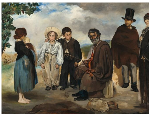
Mone, Edvard. "Qari musiqachi" . 1862. Milliy san'at galereyasi, Vashington

Al-Farobiy musiqa nazariyasiga oid "Kitob al-Musiqa al-Kabir" (Katta musiqa kitobi)da hamda "Fozil odamlar shahri" asarida musiqa inson ruhiga ta'sir etuvchi qudratli vosita ekanini, Ibn Sino ham musiqa nazariyasi bilan shug'ullangan va uni tibbiyot bilan bog'lagan. U musiqani inson salomatligini saqlash va davolash vositasi sifatida ko'rgan. Ibn Sino o'zining "Kitob ash-Shifo"("Shifo kitobi") asarida musiqaning terapevtik xususiyatlarini Tasviriy san'at va musiqaning uyg'unligi qadim zamonlardan boshlab mavjud. Sharq miniatyuralarida musiqachilar va musiqiy cholg'u asboblarning tasviri madaniy hayotning ajralmas qismi bo'lgan. Masalan, Kamoliddin Behzodning miniatyuralarida musiqiy cholg'u asboblari tasvirlanib, ularning marosimlar va bayramlardagi ahamiyati ko'rsatilgan. G'arb san'atida esa, masalan, Leonardo da Vinchi, Karavadjo, P.P.Rubens, Diego Velaskes, Yan Vermeer, Antuan Vatto, Edvard Mone va Pablo Pikasso kabi rassomlar musiqiy asboblarni insonning emotsional holatini ko'rsatish vositasi sifatida tasvirlashdi.