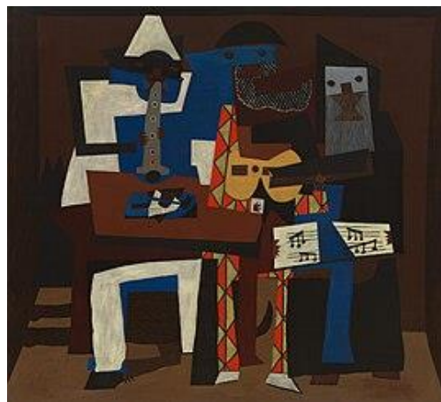
Picasso, P. "Uch musiqachi" . 1921. Zamonaviy san'at muzeyi, Nyu-York

XX asrda Vasiliy Kandinskiy kabi rassomlar musiqani tasviriy san'atning ilhom manbai sifatida ko'rishgan 1 . Kandinskiyning "Kompozitsiya" seriyasi musiqiy ritmlar va ohanglarning vizual shakllar orqali ifodasidir. U musiqaning ranglar va shakllarga ta'sirini ilmiy asosda o'rganib, san'atni sintez qilishga uringan.